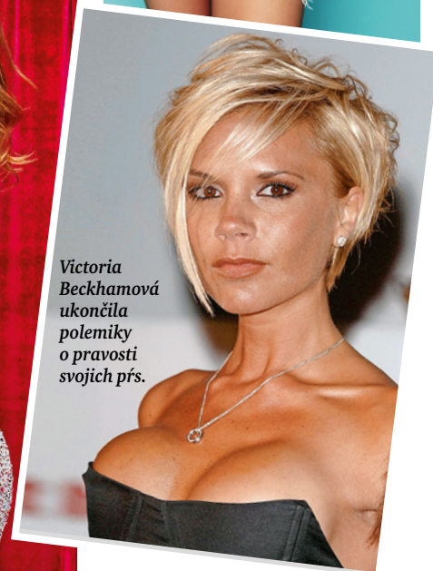
Victoria Beckhamová ukončila polemiky o pravosti svojich prs.